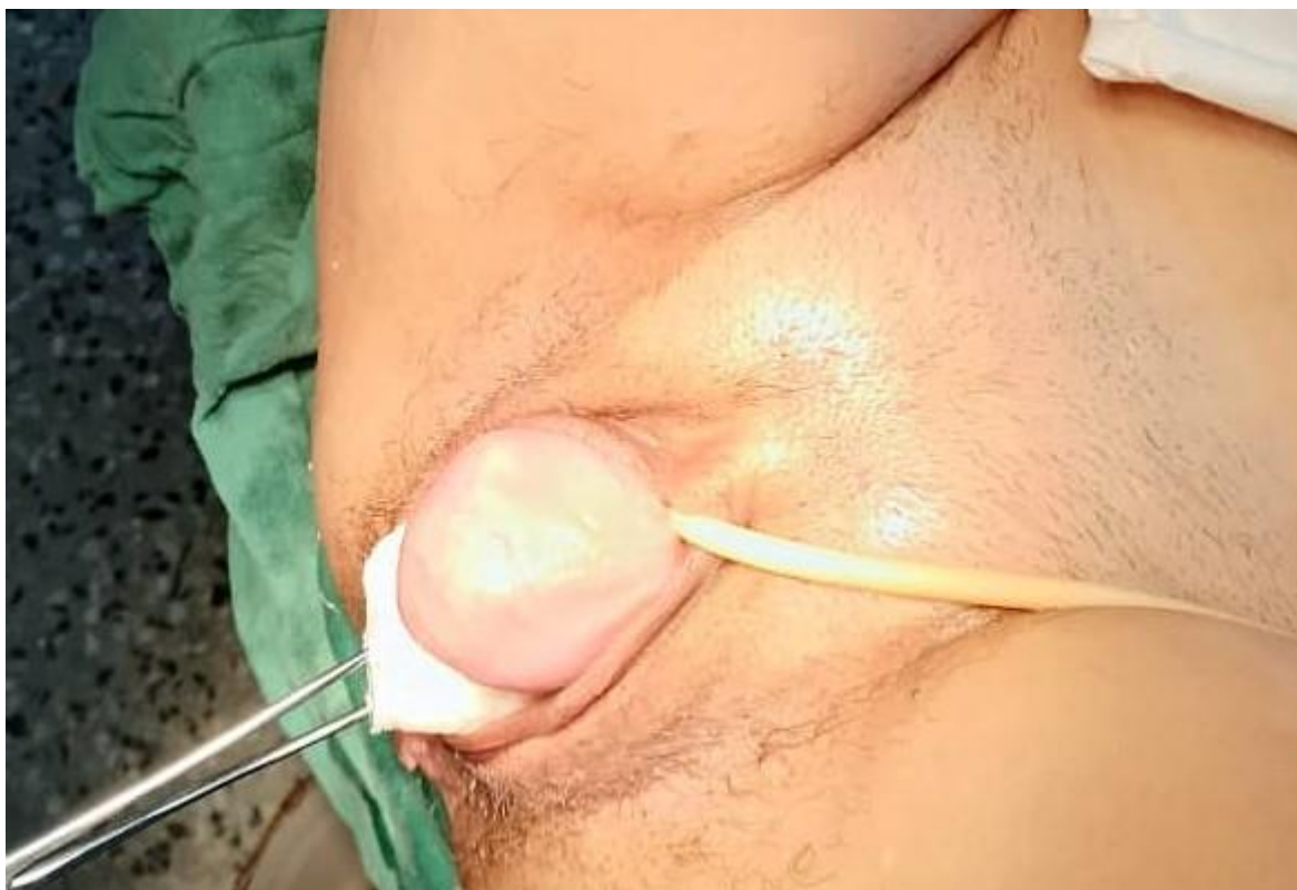
Figura 2. Tumoración a nivel del tercio inferior, pared anterior de vagina, exteriorizada con ayuda de torunda montada en pinza de cuello.