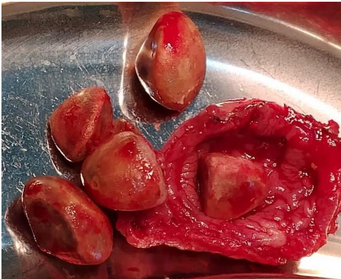
Figura 4. Capsula de la lesión quística y formaciones calculosas entre 1 y 1,5 cm de diámetro.

Durante el procedimiento se produce la apertura accidental de la uretra que se repara en dos planos. Posteriormente se procede a realizar la sutura de la pared anterior de vagina (Fig. 5). La paciente es egresada a las 72 horas y se mantiene con sonda vesical por tres semanas.