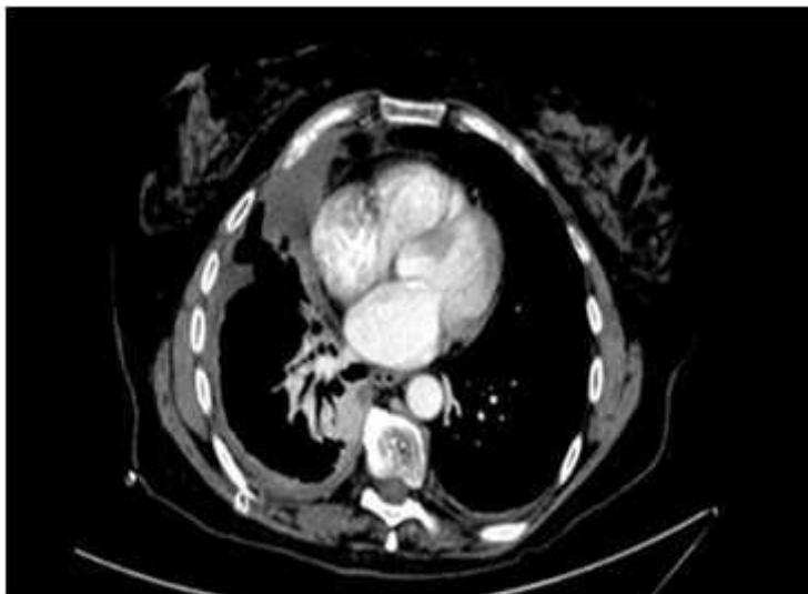
Fig. 3 - TAC toracoabdominopélvico: Derrame pleural izquierdo de disposición libre y derrame pleural derecho.

No se observaron lesiones del parénquima pulmonar o adenopatías mediastínicas, ilíacas o aórticas lumbares.