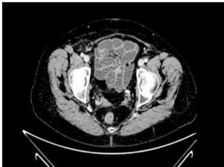
Fig. 5 - TAC toracoabdominopélvico con remisión de la ascitis.

La ascitis después de la cirugía de urgencia y en ausencia de otro factor externo ( Fig. 5 ).