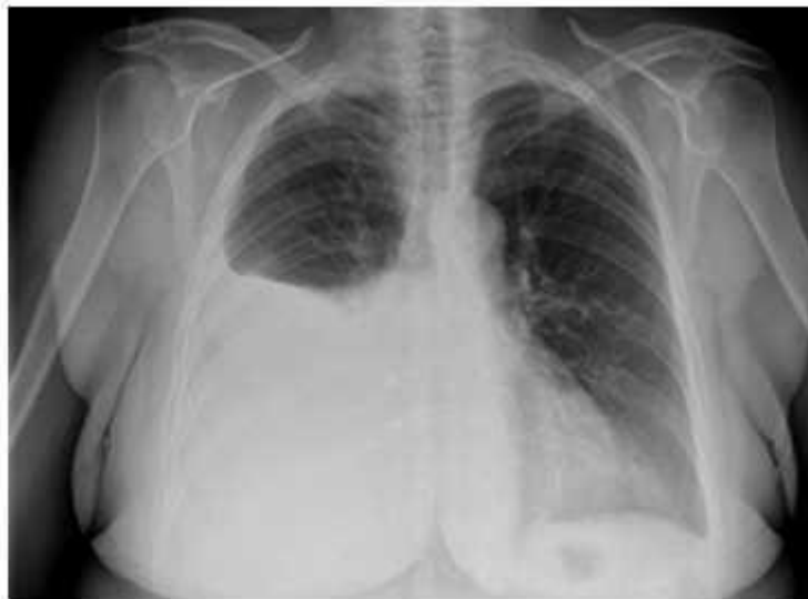
Fig. 1 - Rx tórax: silueta cardiaca de tamaño normal. Pinzamiento del seno costofrénico izquierdo y derrame pleural derecho que ocupa 2/3 del campo pulmonar.

La radiografía de tórax mostró un pinzamiento del seno costofrénico izquierdo y derrame pleural derecho que ocupa 2/3 del campo (Fig. 1).