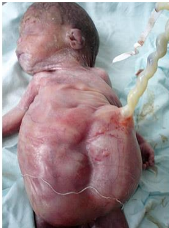
Fig. 1. Recién nacido con características fenotípicas del síndrome de Prune Belly, se destaca la anomalía de la musculatura de la pared abdominal y la distensión abdominal por uropatía obstructiva.

El diagnóstico puede ser sospechado prenatalmente en fetos en quienes se presume masas abdominales causadas por una uropatía obstructiva por valvas uretrales o agenesia uretral ( figura 1 ); otras anomalías del tracto urinario asociadas a este síndrome incluyen uréteres dilatados e hidronefrosis. La displasia renal resulta en oligohidramnios y deformidades relacionadas como la hipoplasia pulmonar que puede llevar a la muerte y deformidades esqueléticas. 1, 3 Las alteraciones cardíacas están presentes en menos del 10% de los pacientes; estas y otras anomalías sistémicas son descritas.