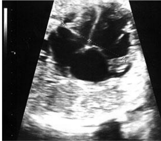
Fig. 2. Dominancia de las cavidades derechas.