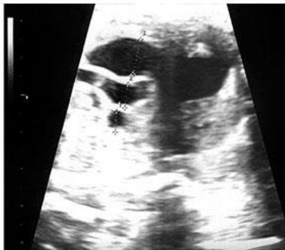
Fig. 4. Dominancia aorta.

Se decide realizar un nuevo control ecográfico en 24 horas y manejo expectante, salvo aparición de signos de insuficiencia cardíaca fetal o anomalías en las pruebas de bienestar fetal.