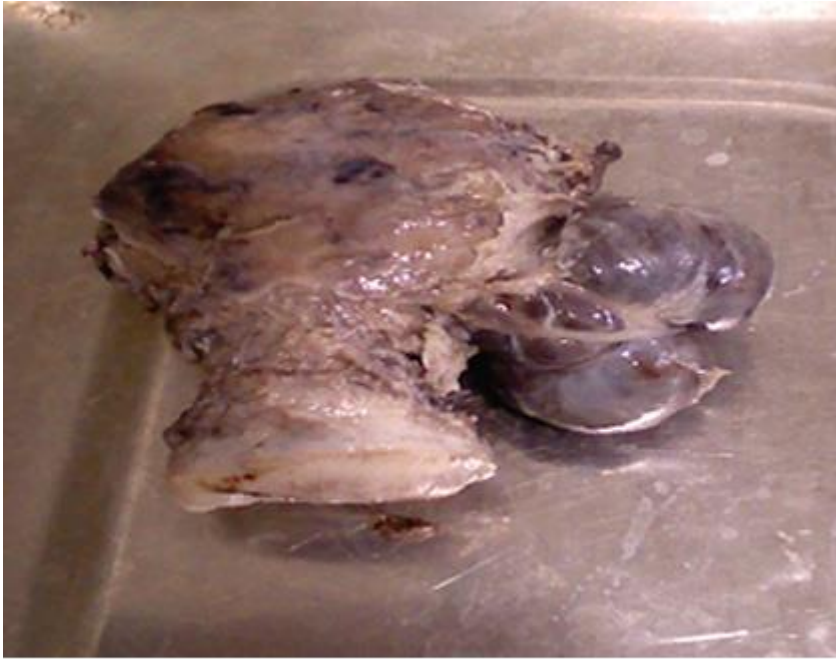
Fig. 2. Cara posterior de útero y hemangioma del borde derecho.