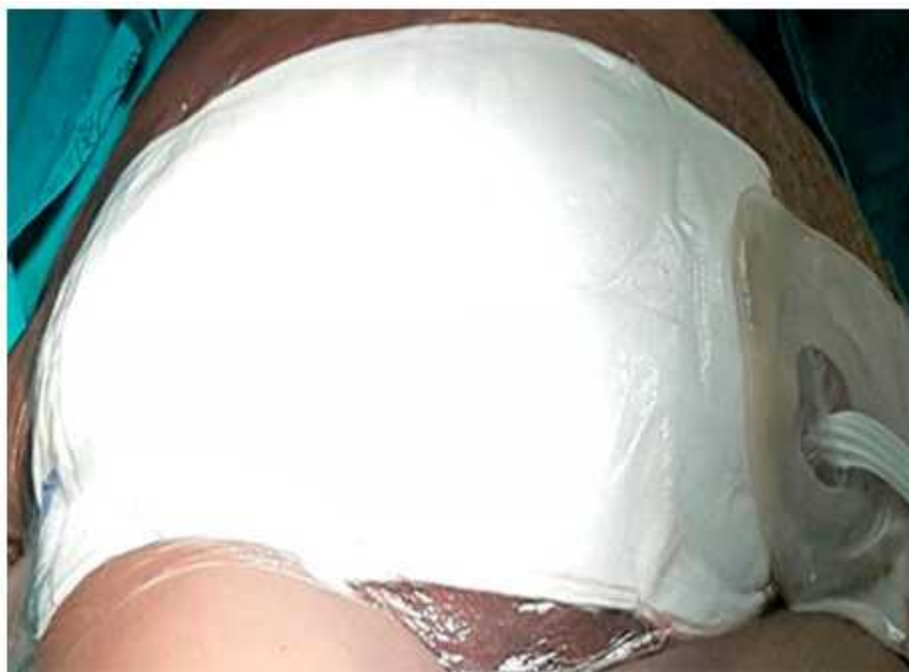
Fig. 4 - Tratamientos posteriores de curas bajo anestesia.

Trece días después la paciente comienza con proceso respiratorio por lo que se le indican rayos X de tórax evolutivo donde se observan lesiones parenquimatosas inflamatorias.