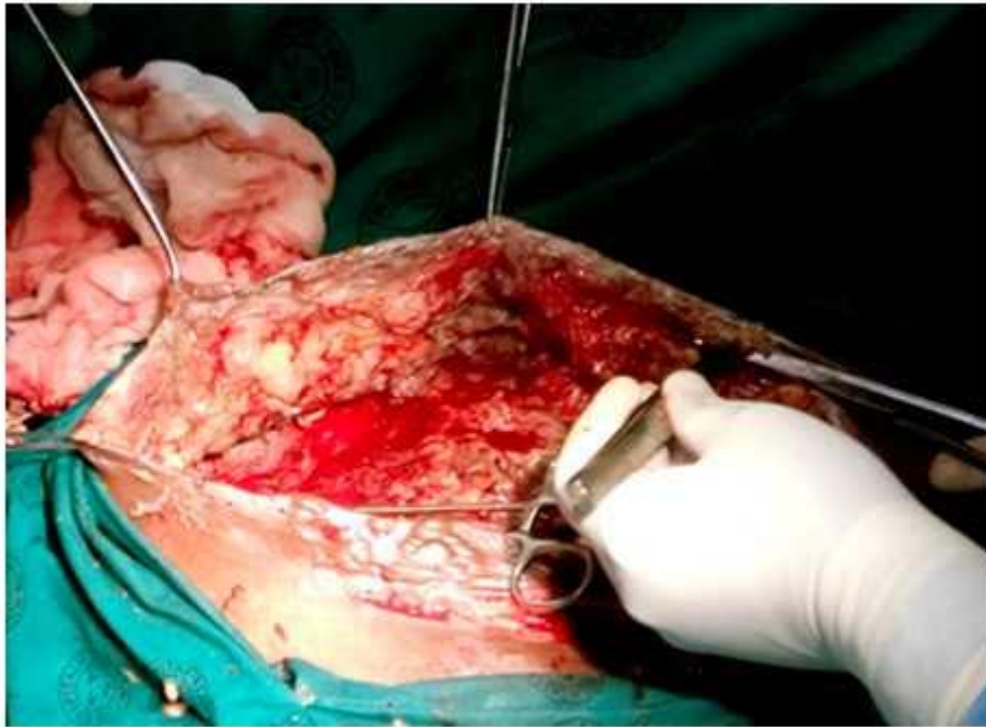
Fig. 2 - Tratamiento quirúrgico de la lesión.

Posterior a la primera cirugía se le realizan otras cinco intervenciones más con el fin de desbridar toda la lesión necrótica ( Fig. 3 y 4 ).