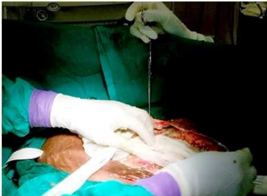
Fig. 3 - Tratamientos posteriores de curas bajo anestesia.

Posterior a la primera cirugía se le realizan otras cinco intervenciones más con el fin de desbridar toda la lesión necrótica ( Fig. 3 y 4 ).